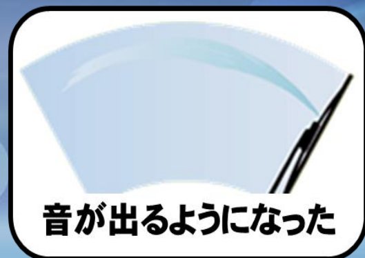
音が出るようになった